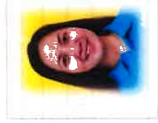
Teacher. Athena (アティーナ先生)