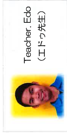
Teacher. Edo (エドウ先生)